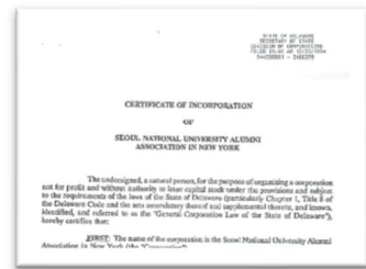
1994.12.29. 델라웨어주에 등록된 미주총동창회 Certificate